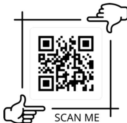
QR-Code zum Video-Trailer auf YouTube

Erleben Sie zu beiden Themen innovative Ideen, Ansätze und Lösungsmöglichkeiten und verschaffen Sie sich elementare Wissensvorsprünge!